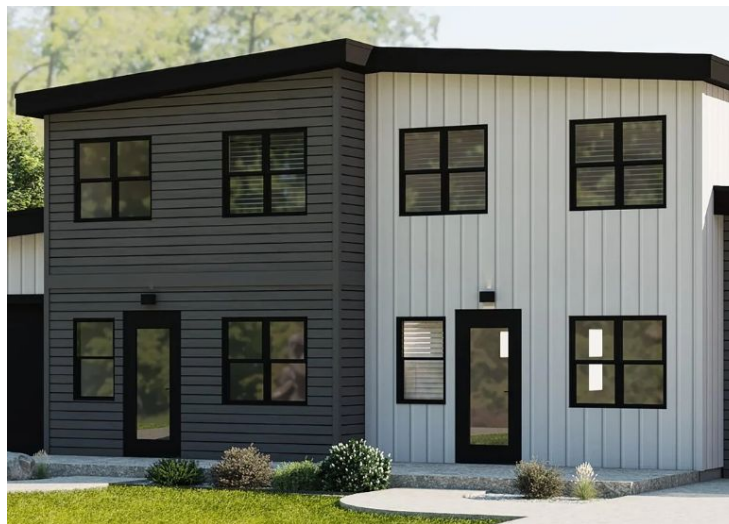
Left: Tierra Colectiva Row Homes on Josephine St.