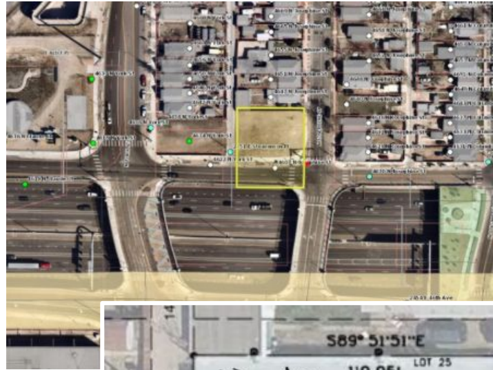
Left: Site location

Below: General concept plan for 4 units with parking and yard space.